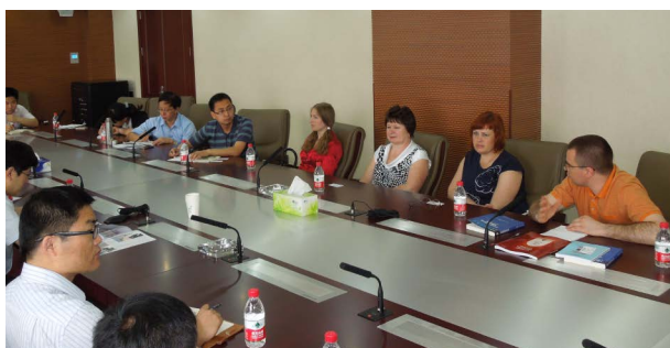
Делегация ИСЭРТ РАН в Китайской академии наук