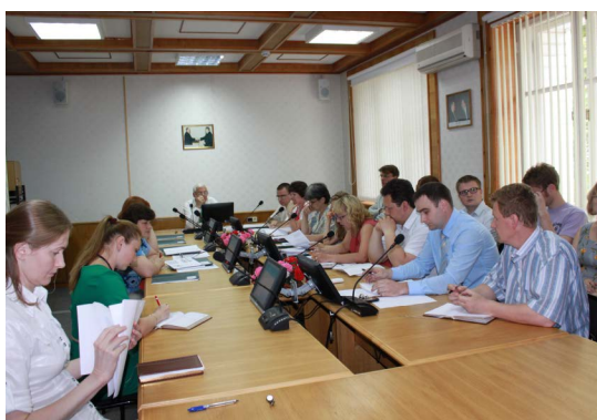
Заседание Учёного совета

В своём выступлении основное внимание он уделил проблеме устойчивого развития промышленности (обрабатывающих производств) как резерву обеспечения высоких темпов экономического роста региона.