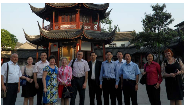
Участники китайско-российского научного семинара

В период с 13 по 18 мая 2013 года делегация Института социально-экономического развития территорий РАН посетила Китай. Российские учёные побывали с визитом в академиях общественных наук городов Шанхай, Наньчан и Пекин.