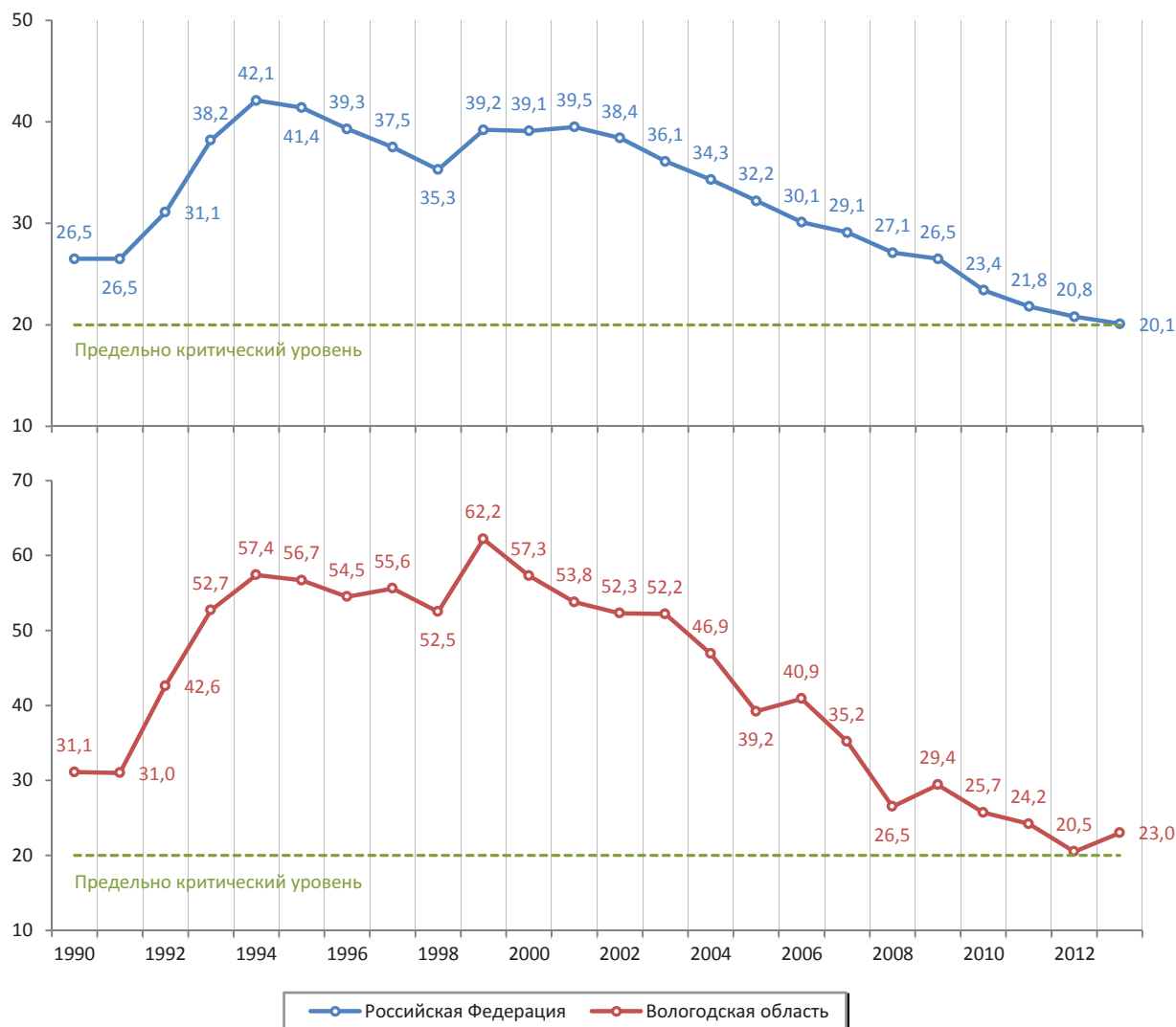
Рис. 2. Уровень смертности от самоубийств, на 100 тыс. чел. населения