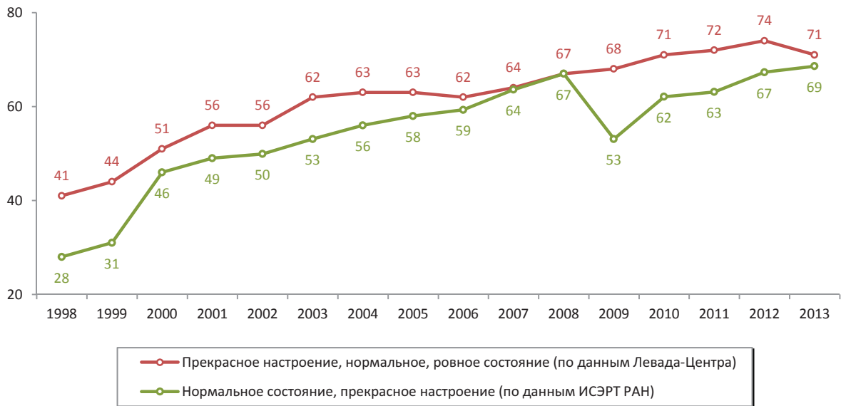
Рис. 3. Доля людей, положительно характеризующих свое настроение, в Российской Федерации и Вологодской области, % от числа опрошенных