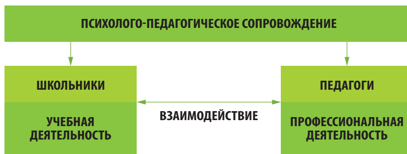
Рис. 1. Организация психолого-педагогического сопровождения школьников и педагогов в НОЦ