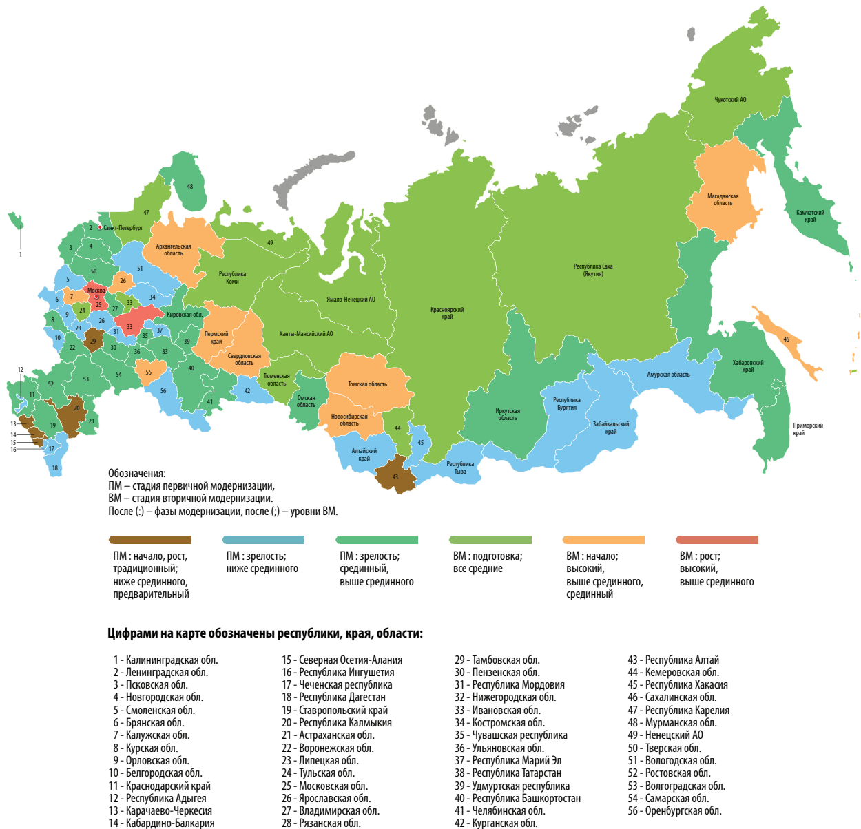
Рис. 1. Картосхема модернизированности регионов РФ, 2012 г.