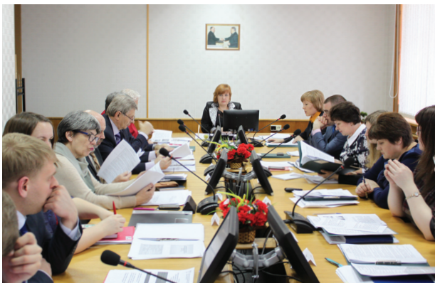
Заседание Ученого совета ИСЭРТ РАН 30.03.2016