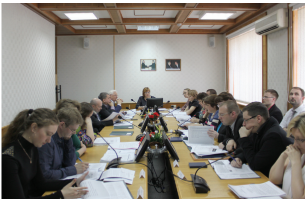
Заседание Ученого совета ИСЭРТ РАН 27.04.2016