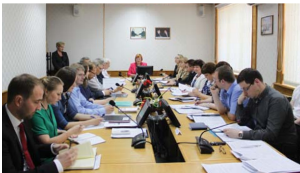
Заседание Ученого совета ИСЭРТ РАН 26.05.2016