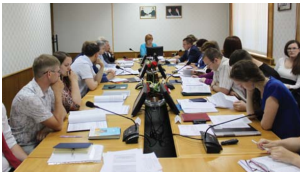
Заседание Ученого совета ИСЭРТ РАН 28.06.2016