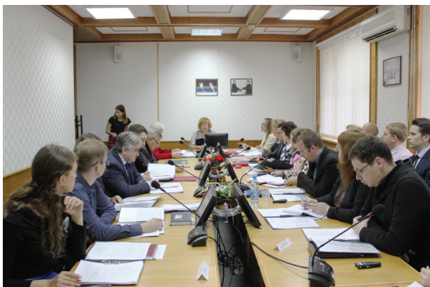
Заседание Ученого совета ИСЭРТ РАН 29.09.2016