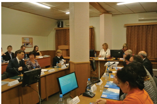
Заседание Ученого совета ИСЭРТ РАН 27.10.2016