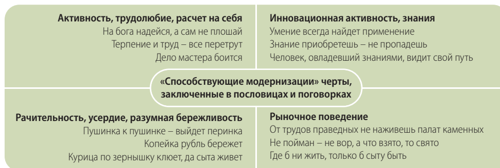
Рис. 2. «Способствующие модернизации» черты, заключенные в пословицах и поговорках

в частности, инновационной активности отмечаются, прежде всего, у «разумных эгоистов» (64 и 34% соответственно). «Ограниченные альтруисты» демонстрируют несколько худший результат, хотя разница не столь существенна. В то же время им сильнее всего свойственна рачительность (28%). «Анархо-индивидуалисты» практически по всем позициям занимают последние места. Исключение составляют черты рыночного поведения, которые в большей степени характерны именно им (25 против 19% у «разумных эгоистов»). Все это позволяет судить о наличии у представителей каждого из кластеров определенной predisposition к различным аспектам модернизации.