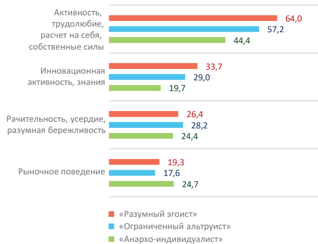
Рис. 3. Степень выраженности различных групп «способствующих модернизации» характеристик населения, в разрезе выделенных кластеров, %

Нахождение среднего арифметического из ответов респондентов по каждому из направлений позволило выделить категории населения, черты которых могут быть особенно полезны для модернизации общества в сложившихся условиях жизнедеятельности. Как видно из рисунка 3, признаки высокой трудовой и,