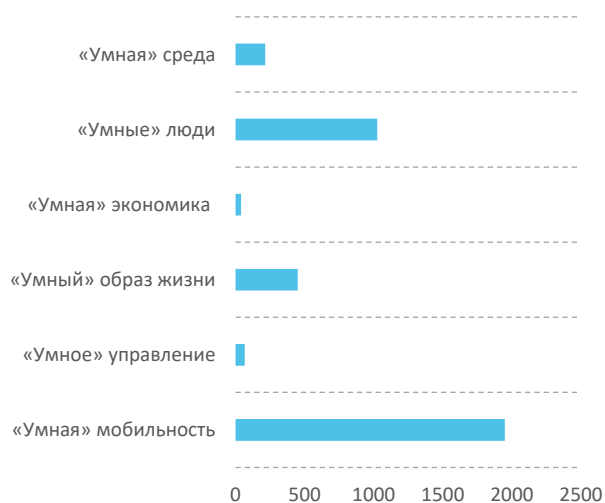
Рис. 4. Направления цифровизации городской среды в Екатеринбурге

В целом развитие сервисов в г. Екатеринбурге на первоначальном этапе смещено в сторону развития транспортной системы, а также повышения интеллектуального капитала граждан (рис. 4).