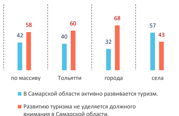
Рис. 1. Выбор респондентами суждений о развитии туризма, % по столбцам

В анкете респондентам были предложены суждения об условиях жизни в Самарском регионе. Одна из пар противоположных суждений имела отношение к туризму. Суждение «в Самарской области активно развивается туризм» нашло поддержку у 42% участников опроса. 58% респондентов выразили согласие с суждением «развитию туризма не уделяется должного внимания в Самарской области» (рис. 1).