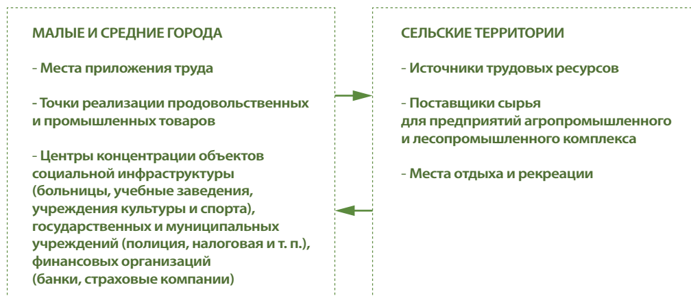
Рис. 2. Взаимодействие малых и средних городов и сельских территорий