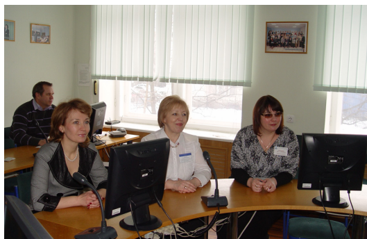
На встрече в филиале ИНЖЭКОНа в г. Вологде

В ходе визита состоялось ее знакомство с деятельностью ВНКЦ ЦЭМИ РАН, филиала Санкт-Петербургского государственного инженерно-экономического университета в г. Вологде.